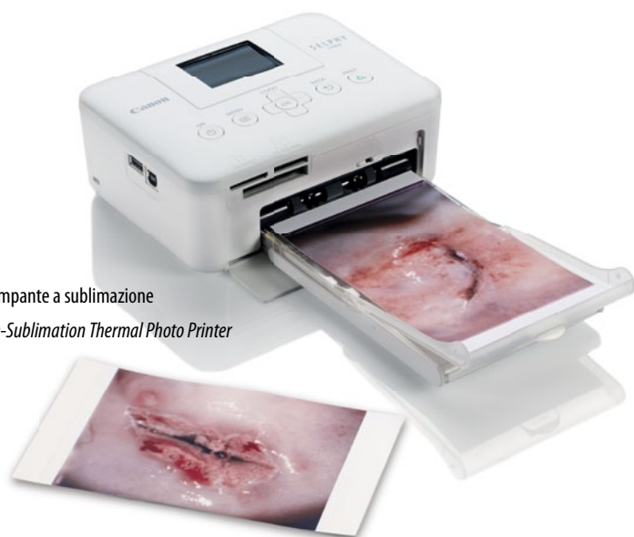
Stampante a sublimazione Dye-Sublimation Thermal Photo Printer