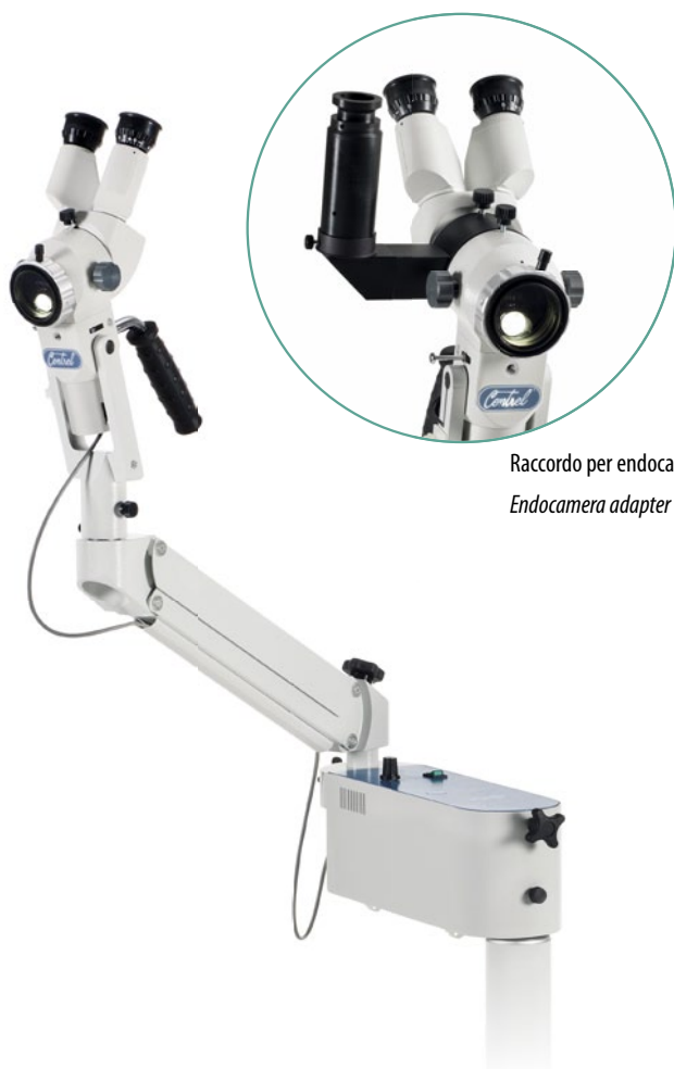
Raccordo per endocamera Endocamera adapter

The photo-colposcopy has become a widespread practice to preserve the own profession and to offer a complete report with pictures to the patient. The mirrorless digital camera with APS-C sensor applied to the C23 or C43 produces High Definition photos and movies, which could also be viewed live on the adjustable LCD monitor. Thanks to the built-in insulation medical transformer, supplied as standard in the stand, the C43 is arranged to accommodate the monitor and the camera in full compliance with the directive for the safety of medical devices. Within few seconds the little sublimation printer produces prints in A6 size with photo quality.